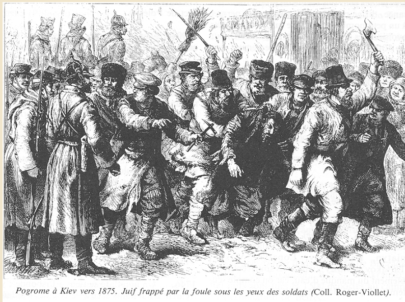
Pogrome à Kiev vers 1875. Juif frappé par la foule sous les yeux des soldats.

Les SS assassinent 1 000 juifs du ghetto d'Antonopol (R.S.S. de Biélorussie).