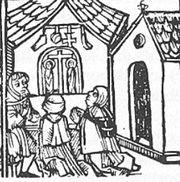
Bois gravé allemand, vers 1480, relatant la prétendue profanation de l'hostie à Passau, Bavière, en 1478.