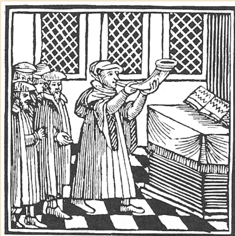
Sonnerie du Shofar pour le Nouvel An, d'après une gravure hollandaise de 1695.