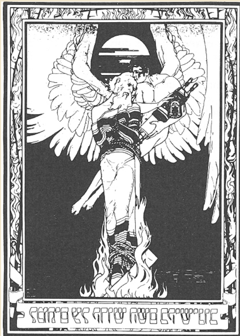
Page de garde de Shornik de Maxime Gorki à la mémoire des victimes du pogrome de Kichinev. (Illustré par E.-M. Lilien.)