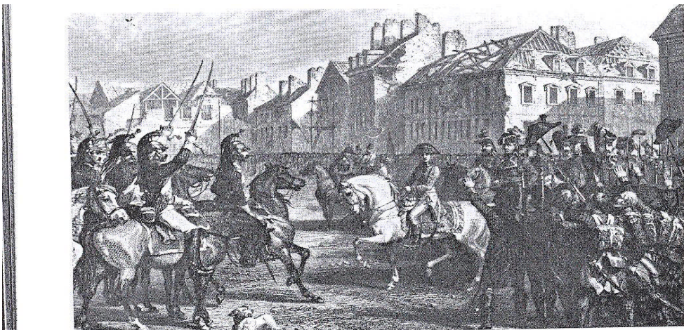
Revue à Lyon, de l'armée d'Égypte, 1798 (Gravure d'après Girardet)