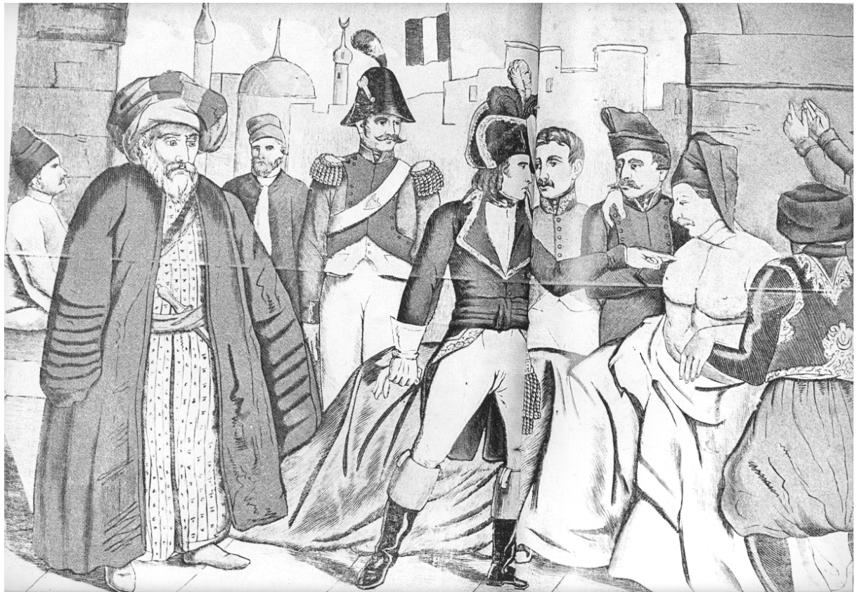
Bonaparte touchant les Pestiférés (Image d'Epinal)